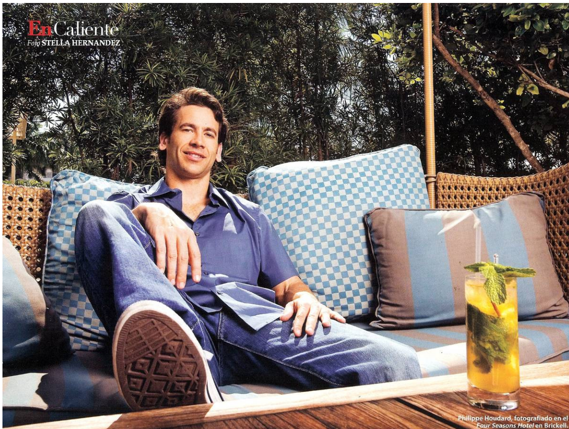
En Caliente