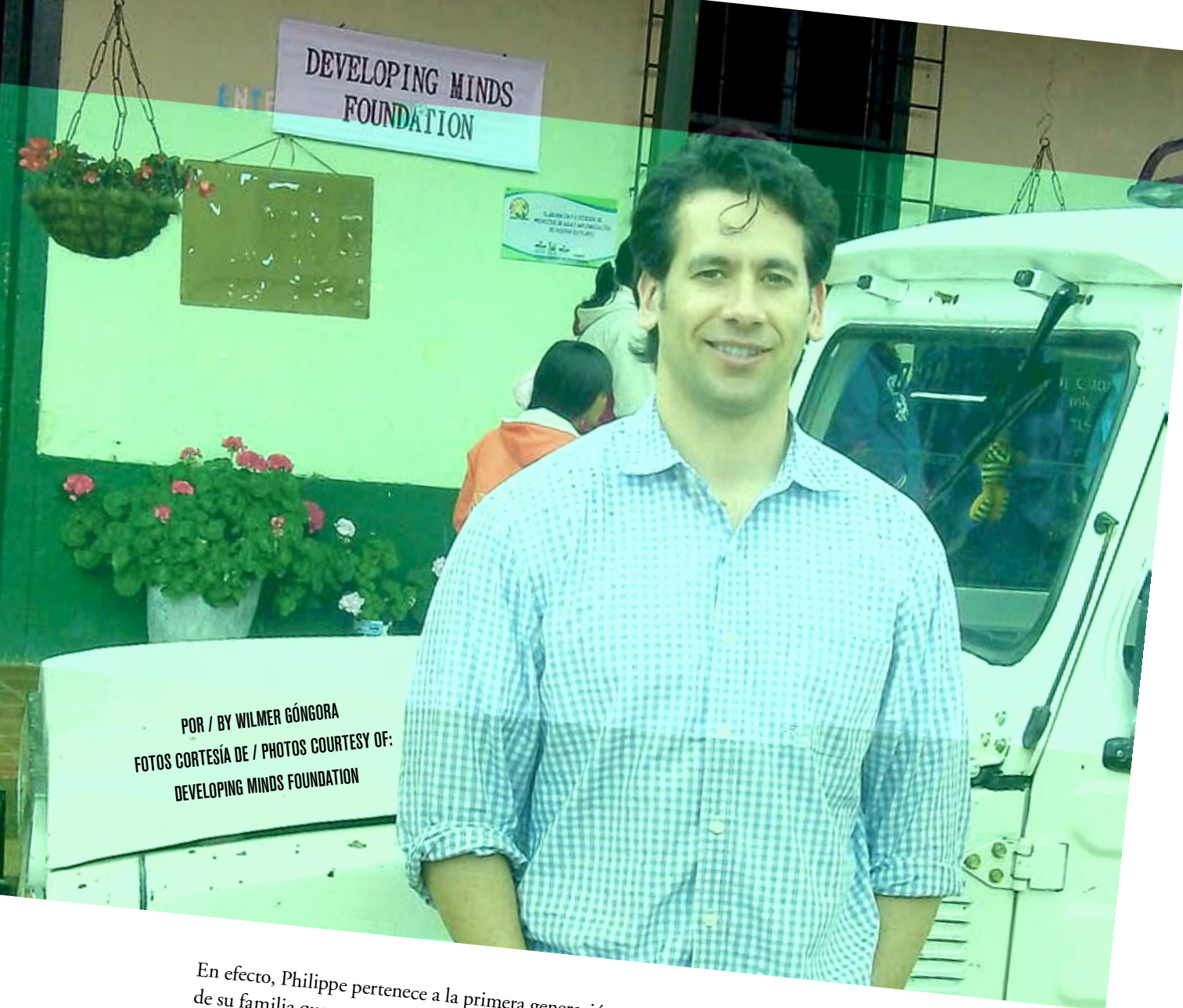
POR / BY WILMER GÓNGORA FOTOS CORTESÍA DE / PHOTOS COURTESY OF: DEVELOPING MINDS FOUNDATION

En efecto, Philippe pertenece a la primera generación de su familia que no va a la guerra: su tatarabuelo combatió en la Primera Guerra Mundial, su abuelo fue prisionero en la Segunda Guerra Mundial y su padre tuvo que cabalgar por los desiertos del norte de África durante la guerra entre Francia y Argelia.